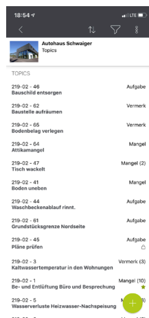
Topics eines Projekts